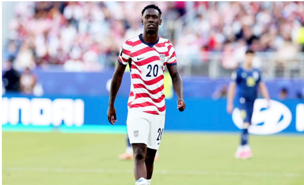
decisión. "¡Gracias a la FIFA por hacer lo correcto y revertir una gran injusticia!", escribió Trump en su plataforma Truth Social.

Refuerzo inesperado. El Comité Disciplinario de la FIFA suspendió la tarjeta roja impuesta a Folarin Balogun durante el partido ante Bosnia y Herzegovina y está presente en el duelo ante Bélgica por los octavos de final del Mundial 2026.