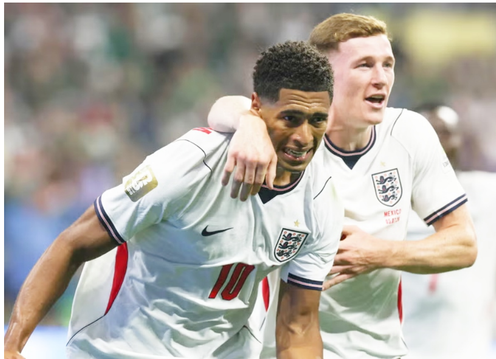
La selección de Inglaterra se clasificó este domingo a los cuartos de final del Mundial 2026 tras derrotar 3-2 a México en el partido que se jugó en el estadio Azteca

de la capital mexicana. Jude Bellingham se reportó con un doblete para los ingleses en los minutos 36 y 38, mientras que Harry Kane convirtió el tercer tanto, de penal, en el 60'.