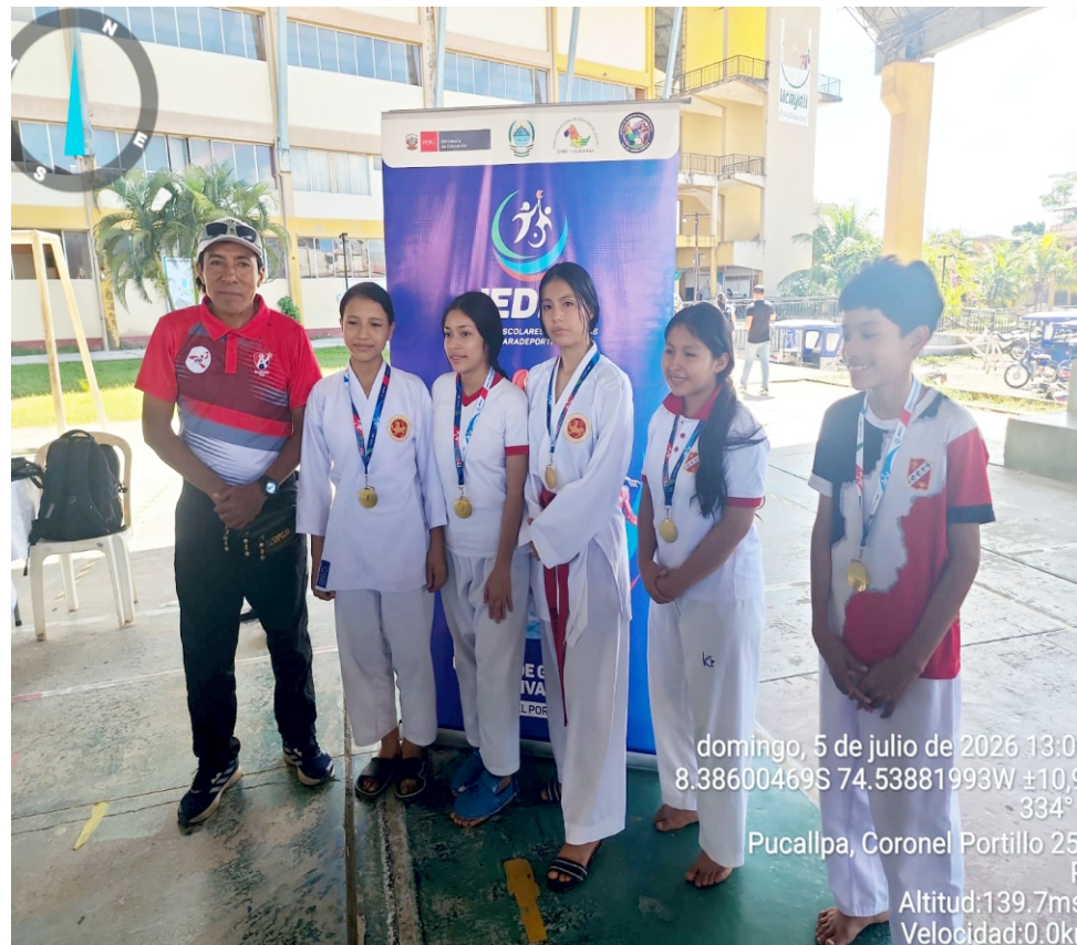
domingo, 5 de julio de 2026 13:00 8.38600469S 74.53881993W ±10.9 -334° Pucallpa, Coronel Portillo 25 Altitud:139.7ms Velocidad:0.0kr

Con estas cinco medallas de oro, la Institución Educativa Emblemática Faustino Maldonado reafirma su compromiso con la formación integral de sus estudiantes y evi-