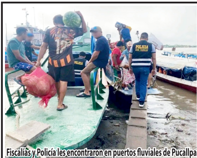
Fiscalía y Policía les encontraron en puertos fluviales de Pucallpa