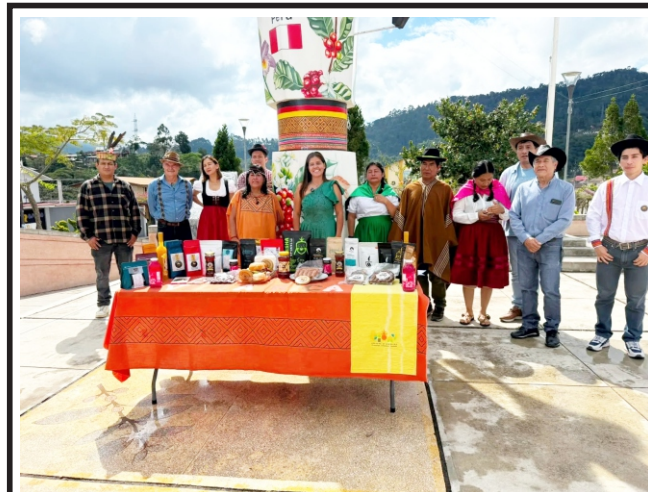
Y tradiciones, por el centenario del distrito con más de 50 productores:

Mientras continuaban las evaluaciones técnicas y el levantamiento de información, las autoridades mantuvieron el control de la zona para facilitar el trabajo de los equipos de emergencia y restablecer progresivamente el tránsito en el sector.