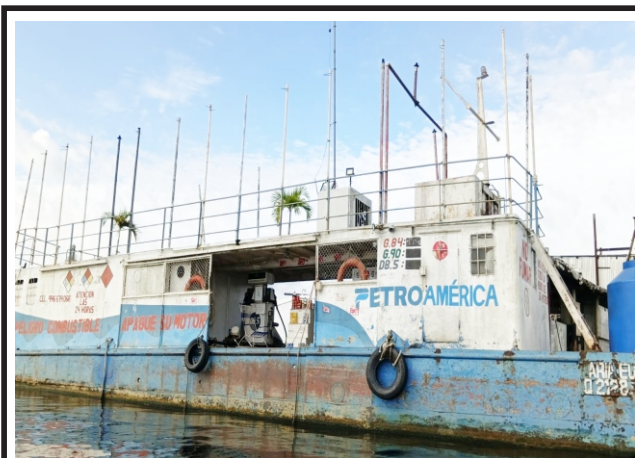
En el río Nanay