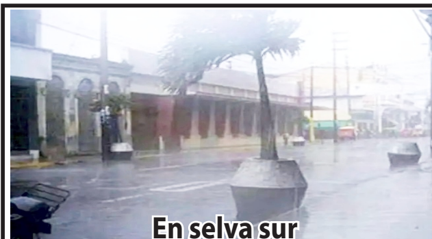
En selva sur