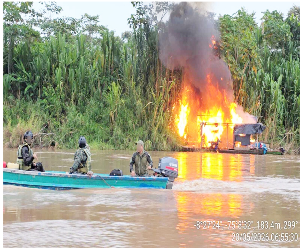
-8°27'24", -75°8'32", 183.4m, 299° 20/05/2026 06:55:30

senta un duro golpe financiero a las economías criminales que financian estas actividades en la región. Además del perjuicio económico a las mafias, la operación evita una mayor degradación del ecosistema acuático del río Aguaytía. Este tipo de minería ilegal destruye los hábitats fluviales y genera altos niveles de contaminación por el uso indiscriminado de sustancias tóxicas como el mercurio, poniendo en grave riesgo la salud de las poblaciones nativas y locales que dependen del río para su subsistencia.