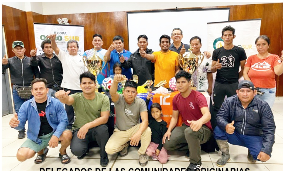
DELEGADOS DE LAS COMUNIDADES ORIGINARIAS

El Grupo Ocho Sur, líder en producción sostenible de palma aceitera en Ucayali, anun-