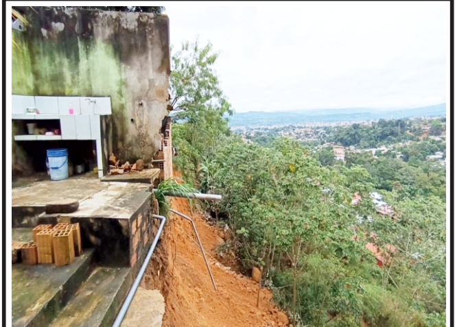
En Asociación de Vivienda El Edén Banda de Shilcayo