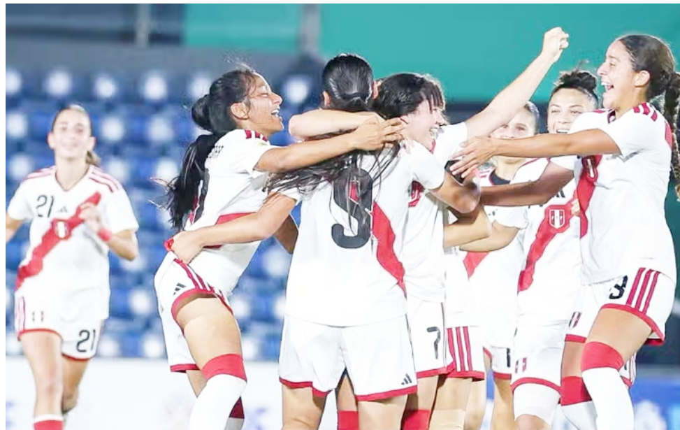
Perú se ilusiona. La Bicolor igualó 1-1 con Ecuador en el partido correspondiente a la fecha 3 del Sudamericano Femenino Sub 17. A los 26 minutos, el cuadro

peruano se puso adelante en el marcador tras un error de Esther Carabalí, quien en su intento de darle un pase a su arquero, la metió en su propio arco.