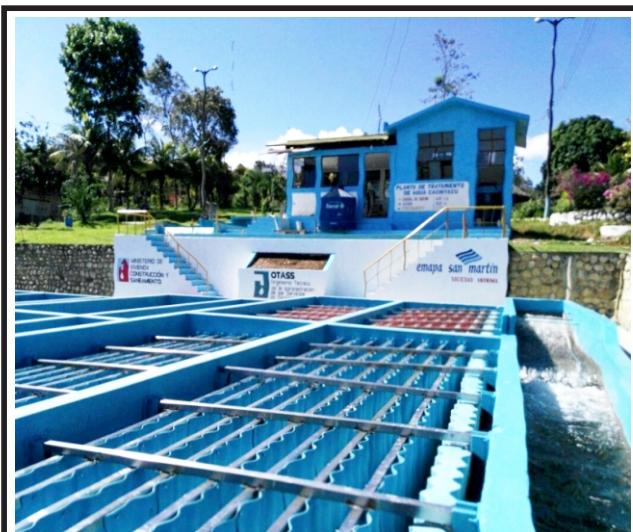
EPS San Martín tras interrupción imprevista por intensas lluvias