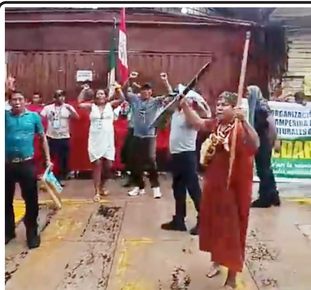
Exigen atención de sus demandas

Finalmente, advirtió que la medida fue de carácter preventivo y que, de no obtener respuestas por parte del Gobierno Central, se evaluará la convocatoria a nuevas jornadas de protesta, incluyendo paros de 24 y 48 horas, lo que podría intensificar el conflicto social en la región. J.Castillo