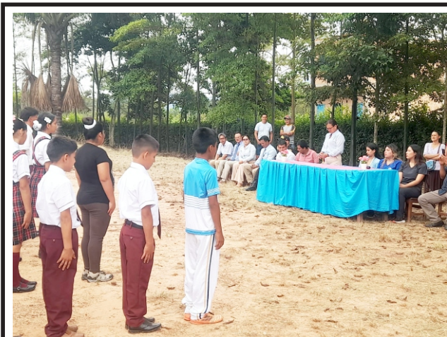
En el distrito de Sauce: