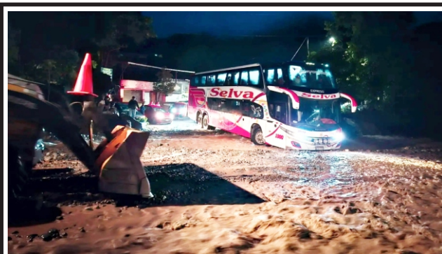
Chanchamayo en emergencia