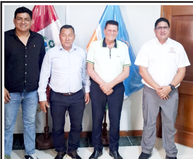
Alcalde de Sauce