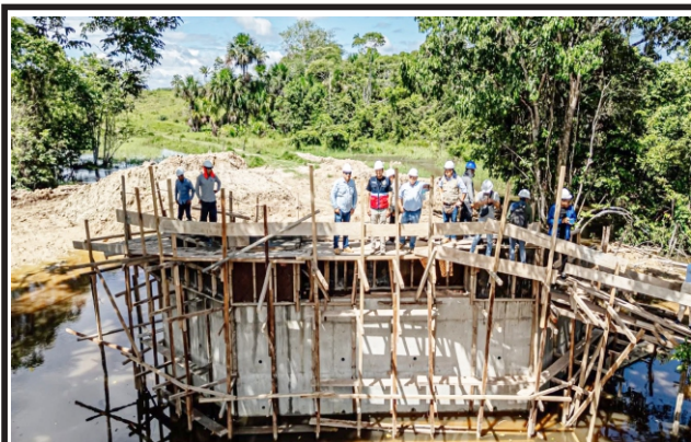
Obras con desarrollo en Alto Amazonas