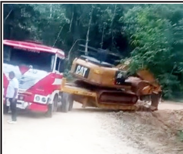
Colapsa plataforma de transporte pesado