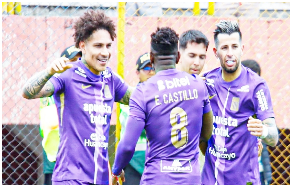
Melgar de local.