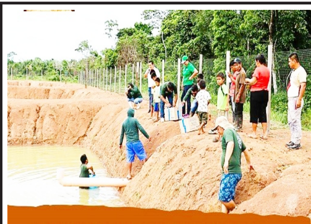
En CN Asháninka de Tunuya