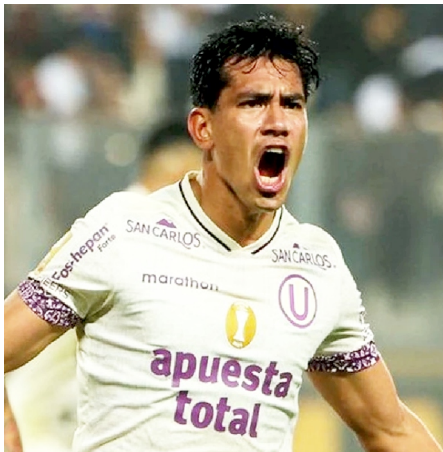
campeonato en la Liga1 Te Apuesto.