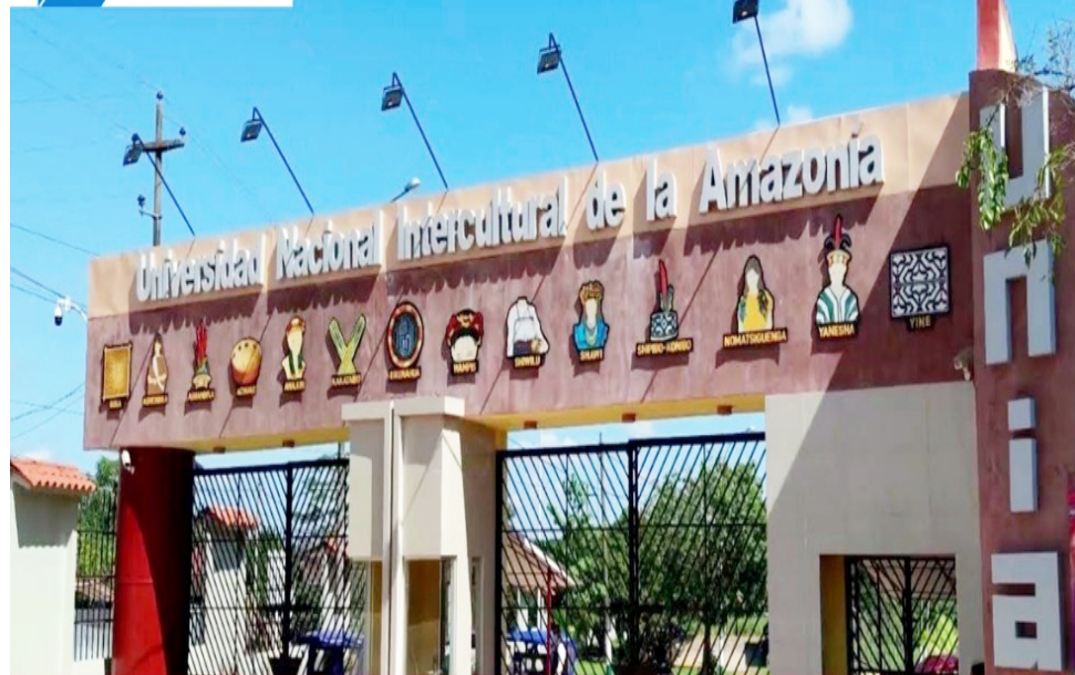
UNIVERSIDAD NACIONAL INTERCULTURAL DE LA AMAZONÍA