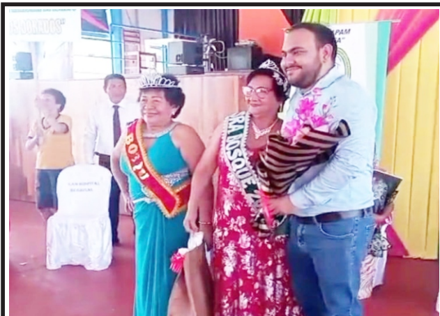
En Hospital Regional de Loreto