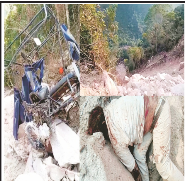
Tragedia en la vía a Sauce