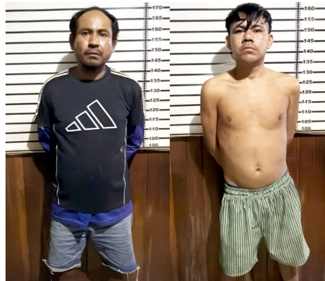
saltara y dejarlos huir", aseveró el denunciante.

"Fui corriendo detrás de ellos, la calle en mal estado con huecos, me ayudó a que les alcanzara y lograr agarrarme en el fierro. Tuve la intención de hacerle voltear el vehículo para que pudieran llevarse, logrando con mi objetivo. Este hecho enfureció a los tripulantes. Los dos que iban de pasajeros me propinaron varios golpes en la cara y cabeza, el cual hizo que