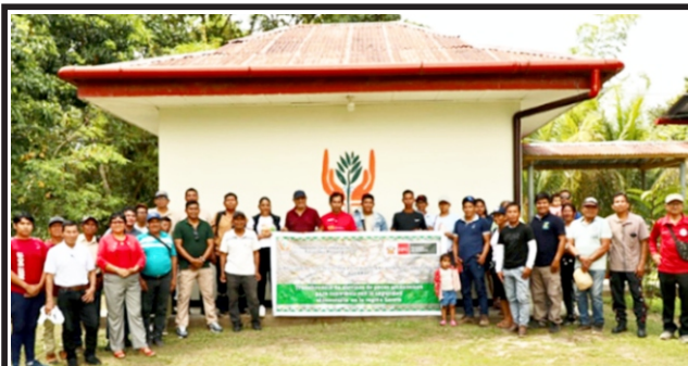
Para acuicultura sostenible en Loreto