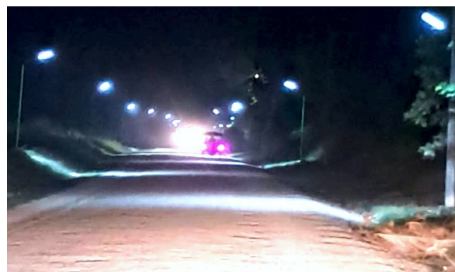
Juanjuí.— La Municipalidad Provincial de Mariscal Cáceres

Esta energía se almacena en baterías solares para su uso durante la noche, permitiendo así una mayor eficiencia energética y una significativa reducción en los costos de consumo eléctrico.