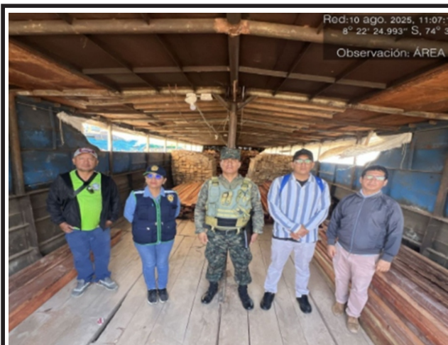
Capitanía de Puerto de Pucallpa en el río Ucayali