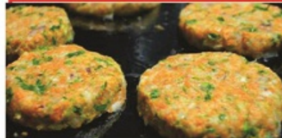
Hamburguesas de zanahorias