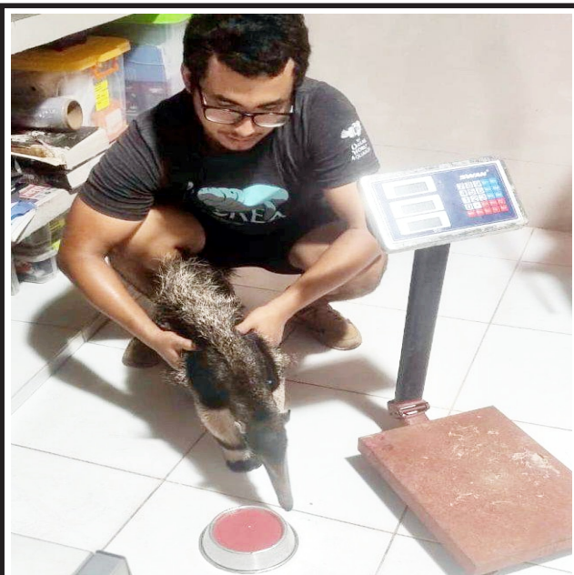
GERFOR en embarcadero "Morochita" en Punchana