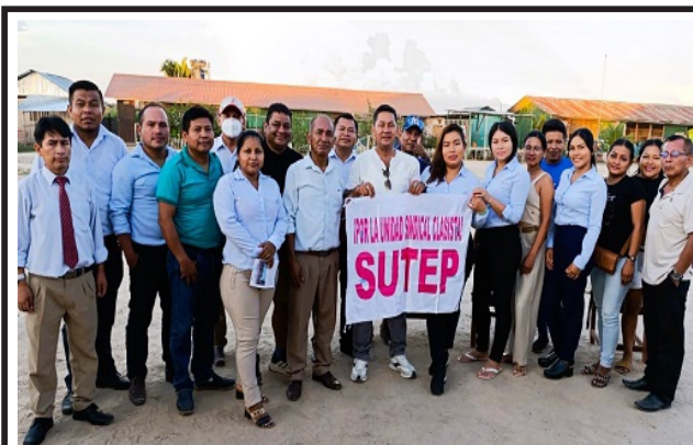
Afiliación se afianza en interior de la región