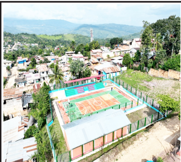
Losas multiuso además beneficiarán a Pillco Marca, Huánuco