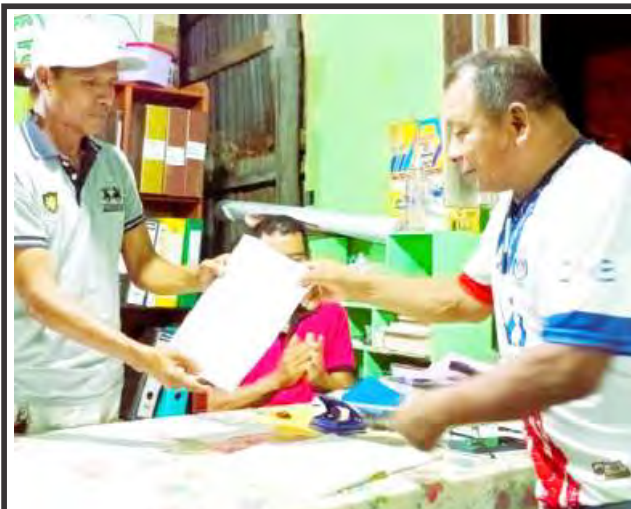
En la Liga San Juan Bautista