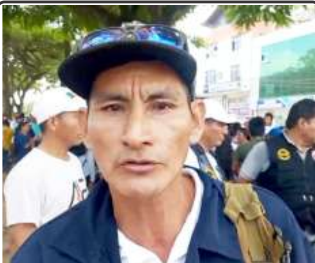
Pobladores de Campo Verde marchan en Pucallpa