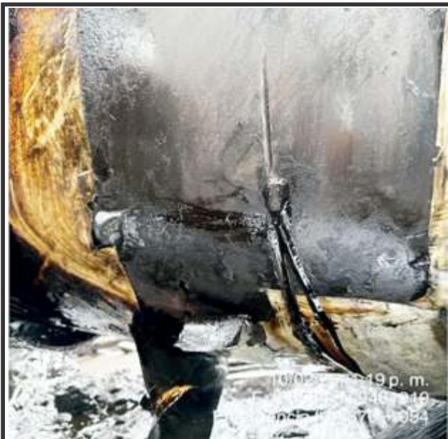
En Condorcanqui, región Amazonas