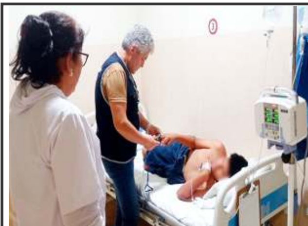
Para ampliar la atención de pacientes afectados por dengue