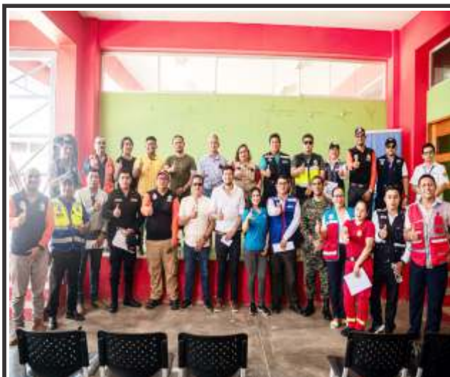
Y programa de aniversario provincia Alto Amazonas