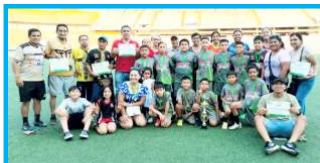
Spartanos Pucallpa Sub 10 Campeones de la Etapa Departamental del campeonato creciendo con el fútbol, quienes representaran a Ucayali del 3 de febrero al 7 de febrero en la ciudad de Huancayo la delegación estará viajando este 30 de enero