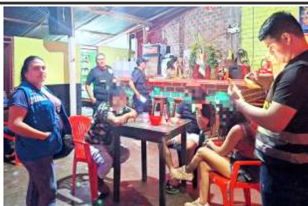
Fiscalía y Policía los rescató en Juanu