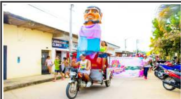
Inician este 29 de enero