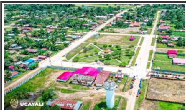
Y garantizará suministro eléctrico en Sepahua