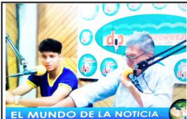
EL MUNDO DE LA NOTICIA