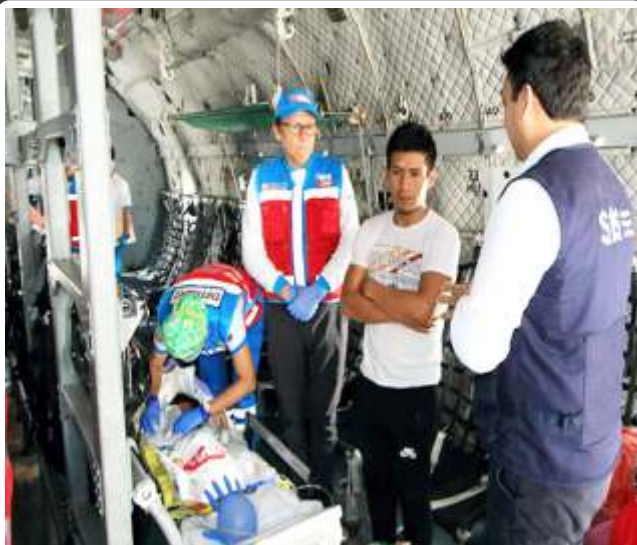
Minsa, SIS y FAP en primer vuelo aeromédico múltiple del año