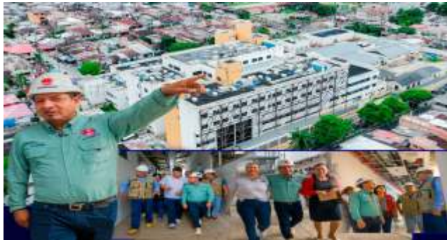
El gobernador regional de Loreto, Dr. René Chávez, supervisó los avances de la obra del Hospital Iquitos "César Garayar García", un proyecto emblemático que busca transformar la atención en salud en la región. Este hospital, que estuvo abandonado durante años en gestiones anteriores, muestra un avance del 36.21% hasta enero de 2025 y está programado para ser entregado en julio de este año.

Actualmente, las estructuras se encuentran al 99% y se ejecutan trabajos de acabados como pintura, pisos y ventanas. Las instalaciones sanitarias presentan un progreso del 60%, las eléctricas del 45%, las mecánicas del 50% y las de comunicaciones del 62%. Uno de los aspectos más destacados del proyecto es que el hospital contará con agua potable las 24 horas del día, lo que garantizará el suministro constante para sus operaciones y