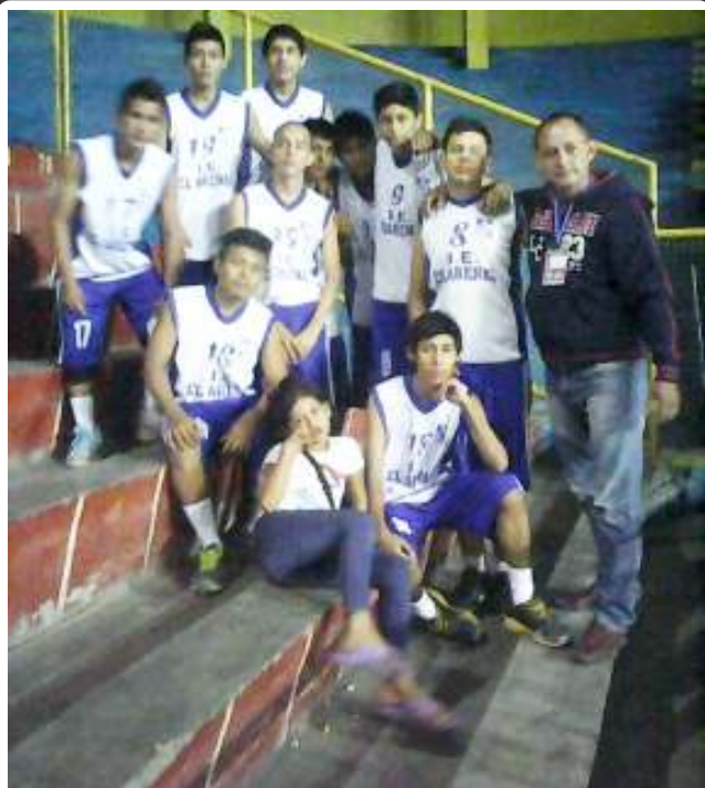
Campeonato Nacional se realiza en Lima, del 20 al 24 de enero