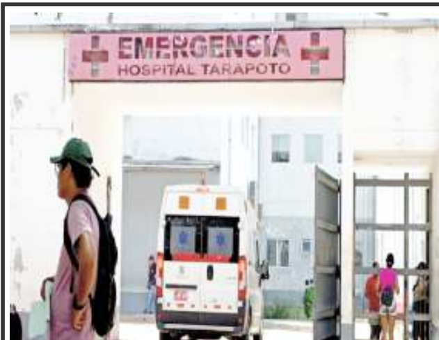
En Tarapoto tras ser referido desde Tocache