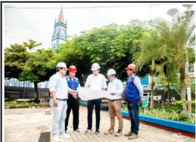
Alcalde de Yurimaguas supervisa trabajos