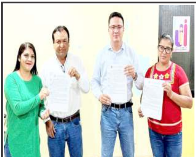
Para atender necesidades de conectividad en el interior de la provincia