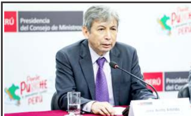
En el presupuesto 2025