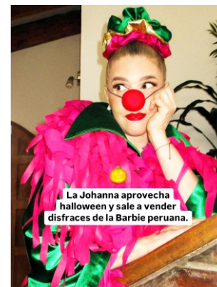
La Johanna aprovecha halloween y sale a vender disfraces de la Barbie peruana.

najes modernos", exclamó la exactriz de Asu Mare.