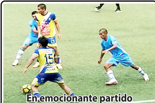
En emocionante partido