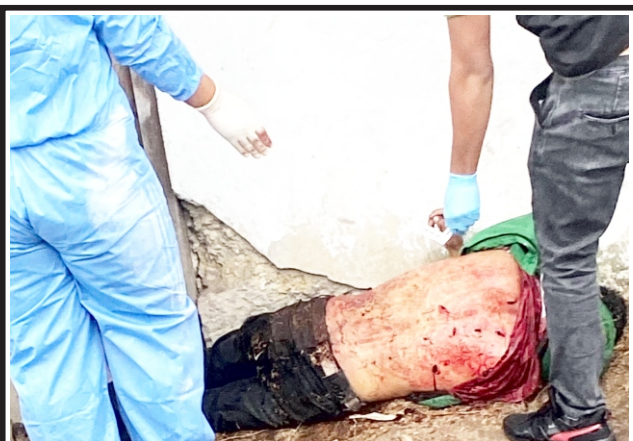
De 7 puñaladas tras salir de fiesta en distrito de Bagua Grande