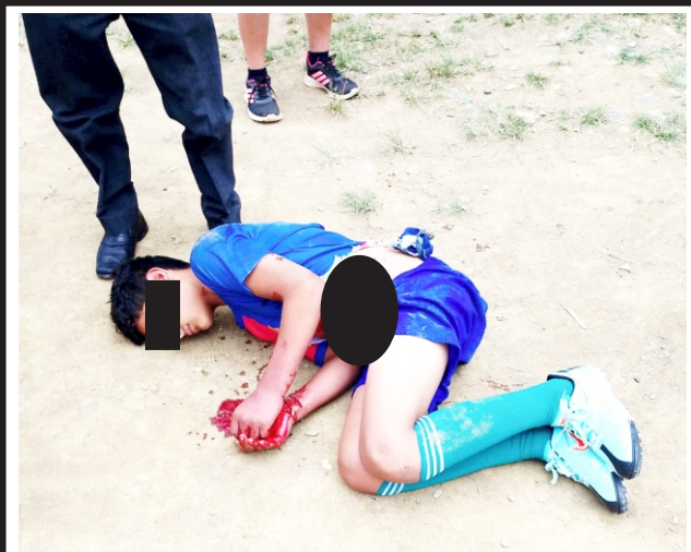
Fue evacuado de Amazonas a Chiclayo con intestinos expuestos