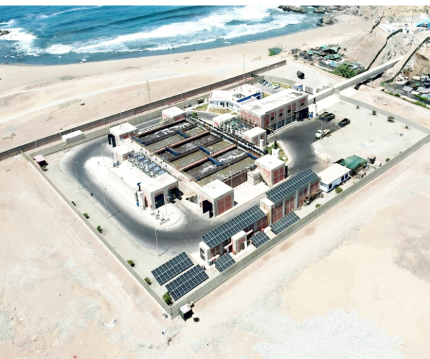
Lima, oct. En agenda 2025. La Agencia de Promoción de la Inversión Privada - ProIn-

versión tiene previsto adjudicar siete proyectos de tratamiento de aguas residuales