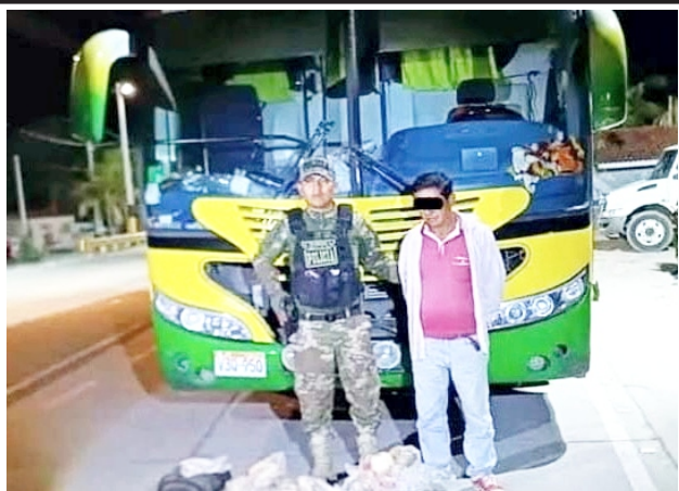
En peaje de Amazonas. Transportaba droga de Yurimaguas a Trujillo