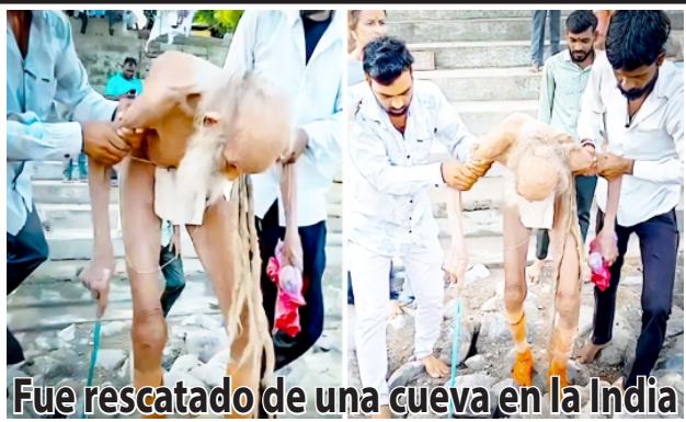
Fue rescatado de una cueva en la India