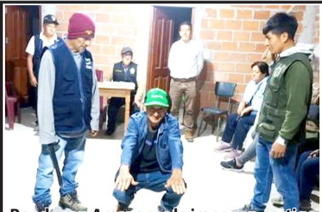
Rondas en Amazonas le imponen castigo