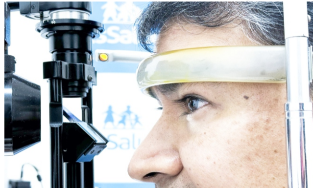
toma de prueba, pues ahora podrán realizarse estos exámenes