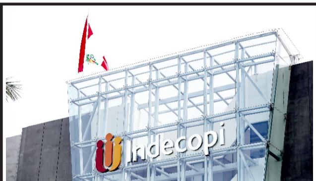
Ratifica que concertan precios al fijar en 200 soles por este servicio