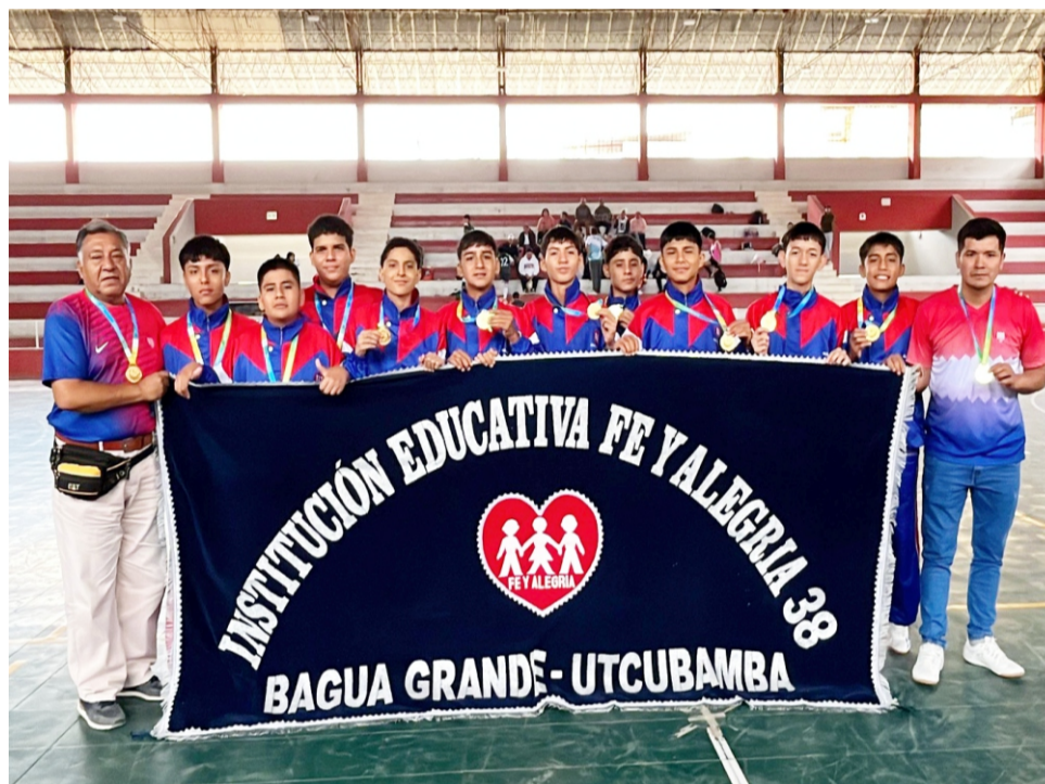
La selección de estudiantes de la institución educativa