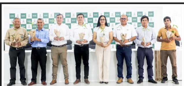
En la ciudad de Bagua