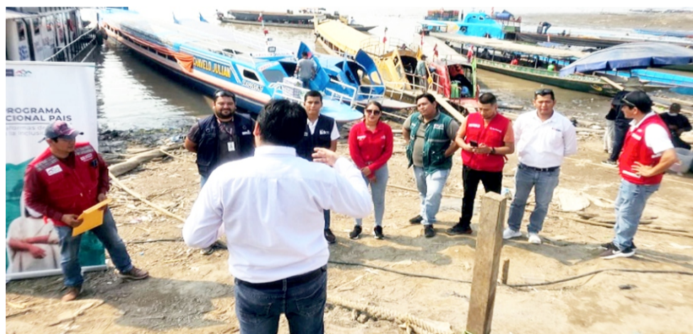
Coronel Portillo, Ucayali, ago. El Programa Nacional

PAIS (Plataformas de Acción Para la Inclusión Social) brin-