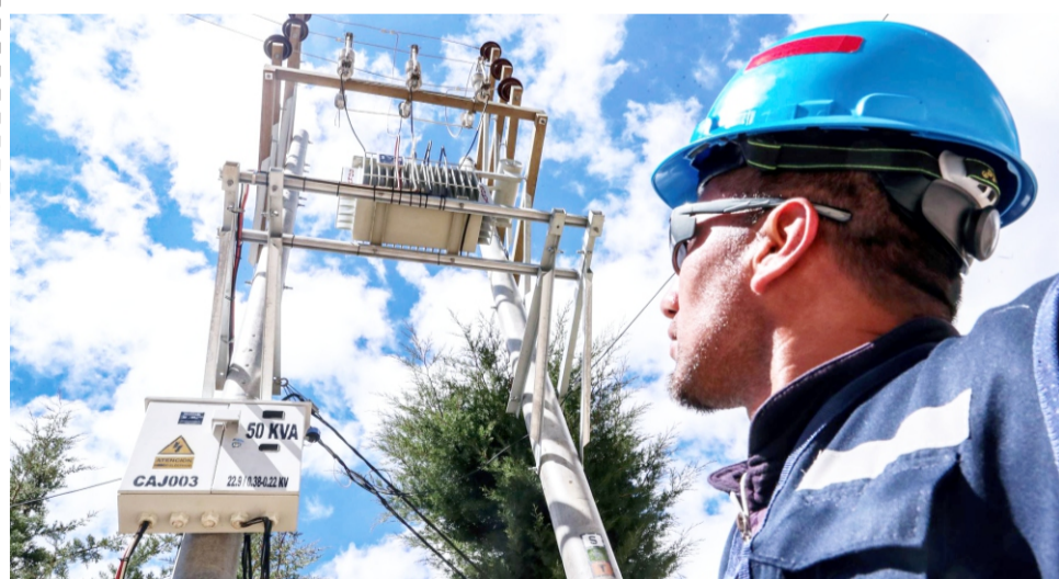
Lima, ago. El Ministerio de Energía y Minas (Minem),

a través de la Dirección General de Electrificación Ru-