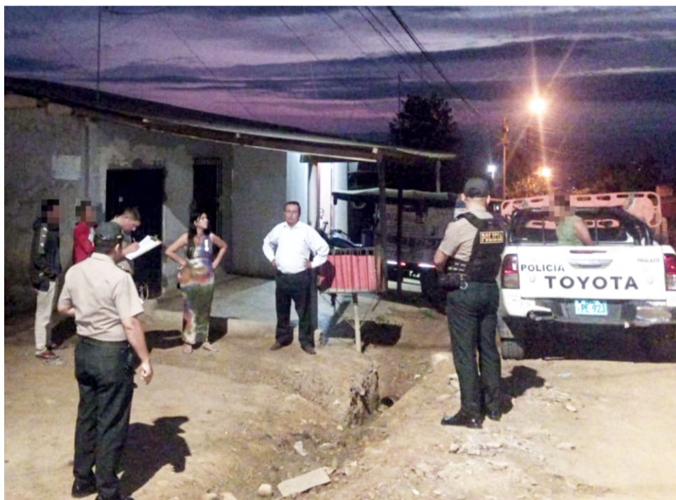
(San Martín, agosto de 2024). - La Fiscalía Provincial Mixta de la Banda de Shilcayo

informó que se impuso nueve meses de prisión preventiva contra el investigado